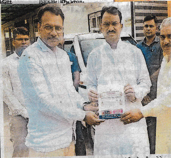
आचार्य समाज के विवाह सम्मेलन के लिए उप मुख्यमंत्री को न्यौता देते हुए